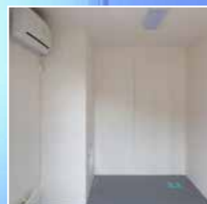
Nisje for utedel AC med luke for inspeksjon AC utedel