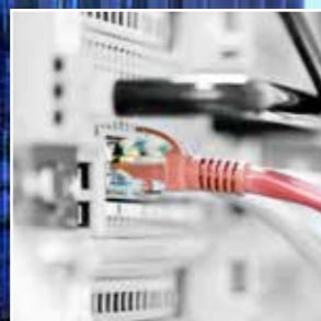
Plass til elektronikkskap på langvegg/endevegg