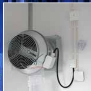
Kjøling kan også utføres med overtrykksvifte med filterkasset