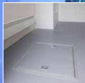
Gulvluke gir enkel tilkomst under huset for trekking av kabler