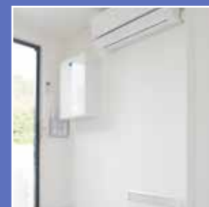
El-installasjon og AC innedel er plassert på samme vegg for best mulig plassutnyttelse

Huset produseres av moduler som er oppbygde av sandwichelement SMB (Sandwich-Module-Building). Elementene består av fra innsiden og ut hvitmalt fiberplater, isolering og ytterkledning av pulverlakkert, galvanisert stålplate. Disse limes sammen til en enhet. Byggeteiden gir et tilnærmet vedlikeholdsfritt hus der risikoen for råte, fukt og kulde-brøer helt elimineres. Huset har isolasjonsverdi/U-verdi 0,45. Andre anvendelser for SMB-element er tog, båter, fly, termolastebiler, busser, kjølerom mm.