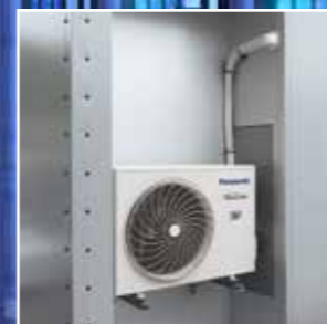
AC utedel plassert bak ventilasjonsgitter for å unngå hærverk