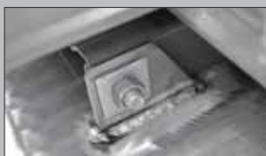
Enkel og solid innfesting av transformator.