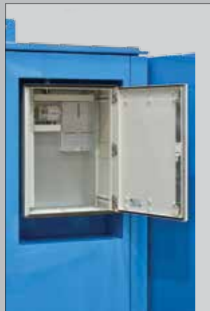
Mulighet for nisje for målerskap eller utvendige stikkontakter.