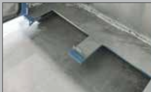
Dype utsparinger for kabler gir store bøyeradier på kablene både på høy- og lavspenningsiden.