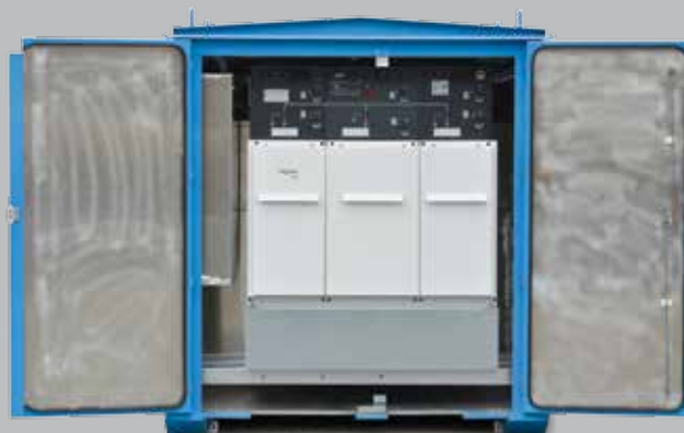
Høyspennings kompaktanlegg med 3 kurser plassert på sokkel for god tilgang og plass til kabler.