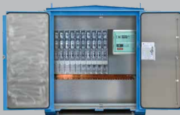
Lavspenningstavle leveres med sikringslister eller effektbrytere. Måleinstrument i eget skap for bedre beskyttelse mot fukt.

Standard størrelse er: L x B x H = 2900 x 1900 x 2080. 800 kVA transformatorer. 3 -kurs høyspenningsanlegg. Lavspenningstavle for 10 sikringslister. Totalvekt 4 700 kg.