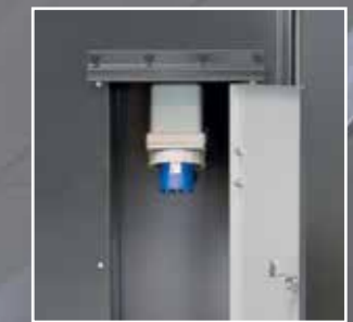
Aggregatkontakt for ekstern strømforsyning.