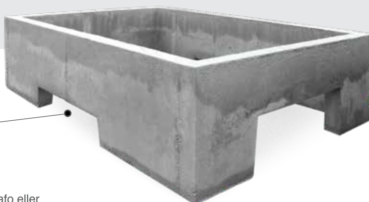
Prestøpt ringmur med hull eller utsparinger for kabeltrekkinge, tilpasset leveransen.

For flere detaljer kontakt Møre Trafo eller besøk vår hjemmeside www.moretrafo.no