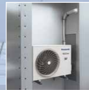
AC utedel plassert bak ventilasjonsgritter for å unngå hærværk,

Huset er oppbygd av prefabrikerte elementer. På innsiden stålbelagt kryssfinér. Isolasjon er XPS-skum. På utsiden er det prelakkert (Green-coat), galvaniserte stålplater. Byggemetoden gir et tilnærmet, vedlikeholdsfritt hus, der risiko for råte, fukt og kuldebroer elimineres. Huset har isolasjonsverdi/U-verdi på 0,38. Ved å bruke isolasjonsmateriale av hardpresset Rockwool i stedet for XPS-skum, oppnås brannklasse EI/REI 60.