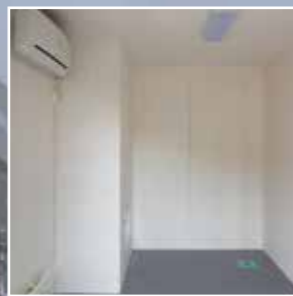
Nisje for utedel AC med luke for inspeksjon AC utedel.