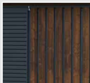
Ytterkledning i pulverlakkerte, galvaniserte stålplater med farge Grå RAL 7021, kombinert med impregret trepanel.