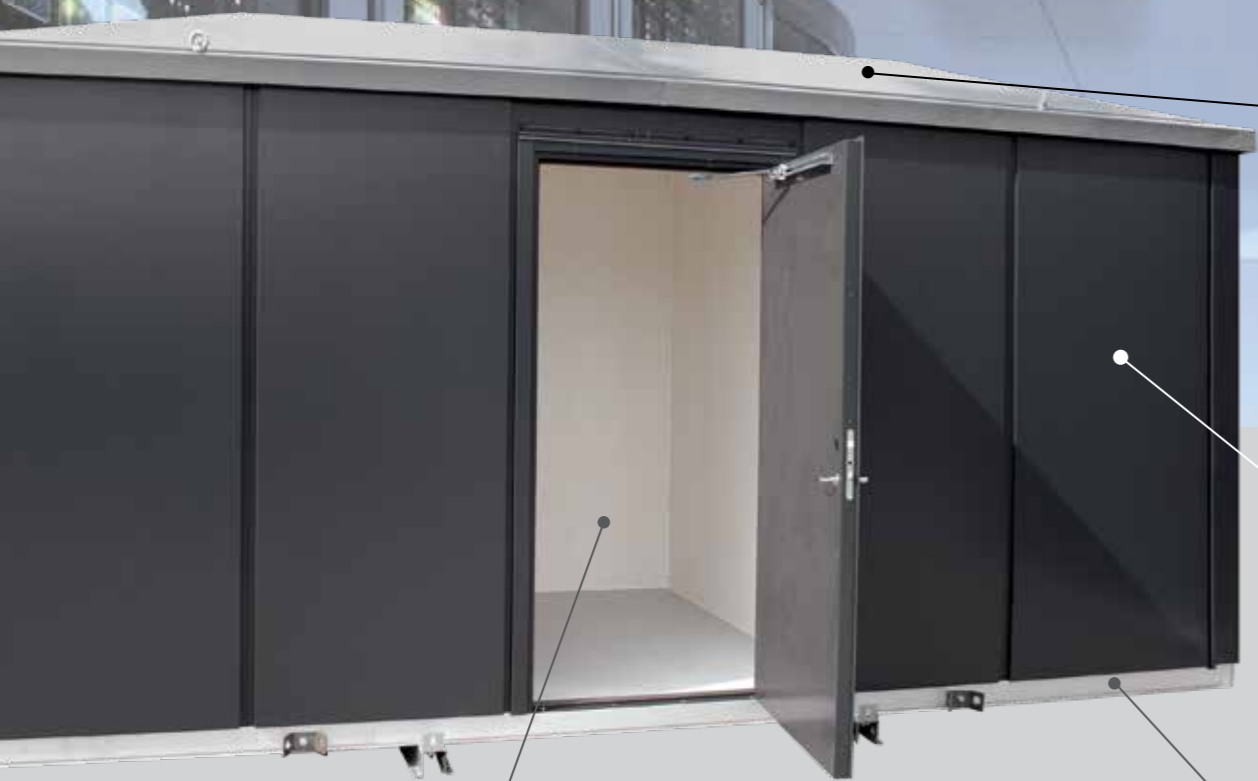
Tak i glassfiberarmert polyester er lett og sterkt. Gelcoat holder taket pent i mange år