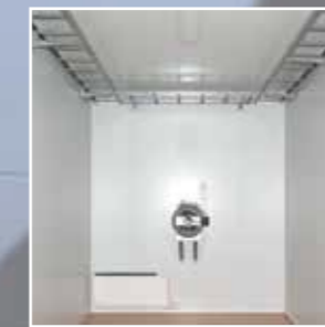
Premonterte kabelstiger ved tak.