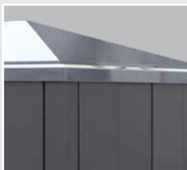
Tak av glassfiberarmert polyester (GRP) er standard.

Våre teknikkhus er utvendig designet for å passe sammen med nettstasjonene i MAXI-serien. Dette gir et enhetlig, visuelt uttrykk for flere typer av infrastruktur.