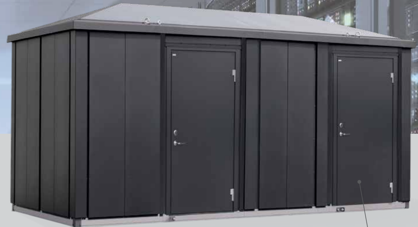
Integrert fundament, produsert i 3 mm galvanisert stål.