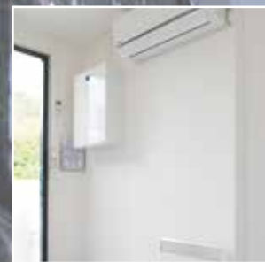
El-installasjon og AC inne- del er plassert på samme vegg for best mulig plass- utnyttelse