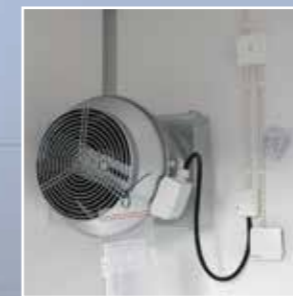
Kjøling kan også med overtrykksvifte med fiber- kassett