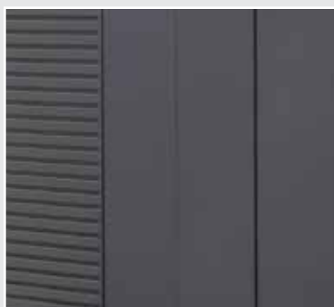
Ytterkledning i pulverlakkerte, galvaniserte stålplater med farge Grå RAL 7021.