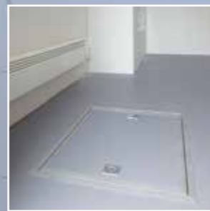
Gulvluke gir enkel tilkomst under huset for trekking av kabler.

Huset er oppbygd av prefabrikerte elementer. På innsiden stålbelagt kryssfinér. Isolasjon er XPS-skum. På utsiden er det prelakkert (Green-coat), galvaniserte stålplater. Byggemetoden gir et tilnærmet, vedlikeholdsfritt hus, der risiko for råte, fukt og kuldebroer elimineres. Huset har isolasjonsverdi/U-verdi på 0,38. Ved å bruke isolasjonsmateriale av hardpresset Rockwool i stedet for XPS-skum, oppnås brannklasse EI/REI 60.